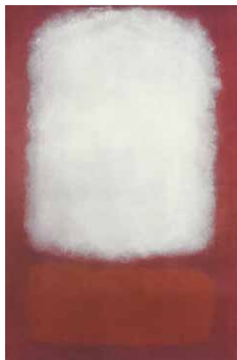
^ Mark Rothko, untitled 1959

"Elk beeld dat we van God maken schiet te kort"