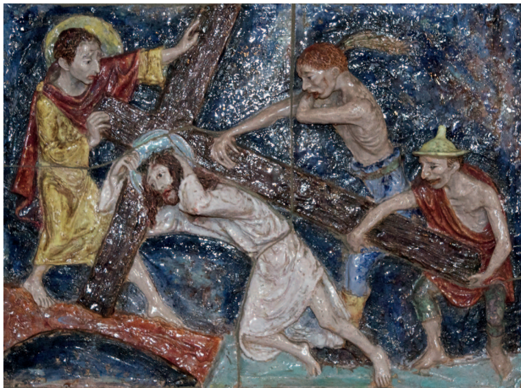
^ Keramieke Kruiswegstatie in de OLV kerk in Bentelo.