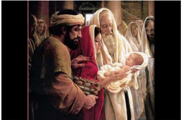
Toewijding van Jezus in de tempel Simeon en Hanna loven God