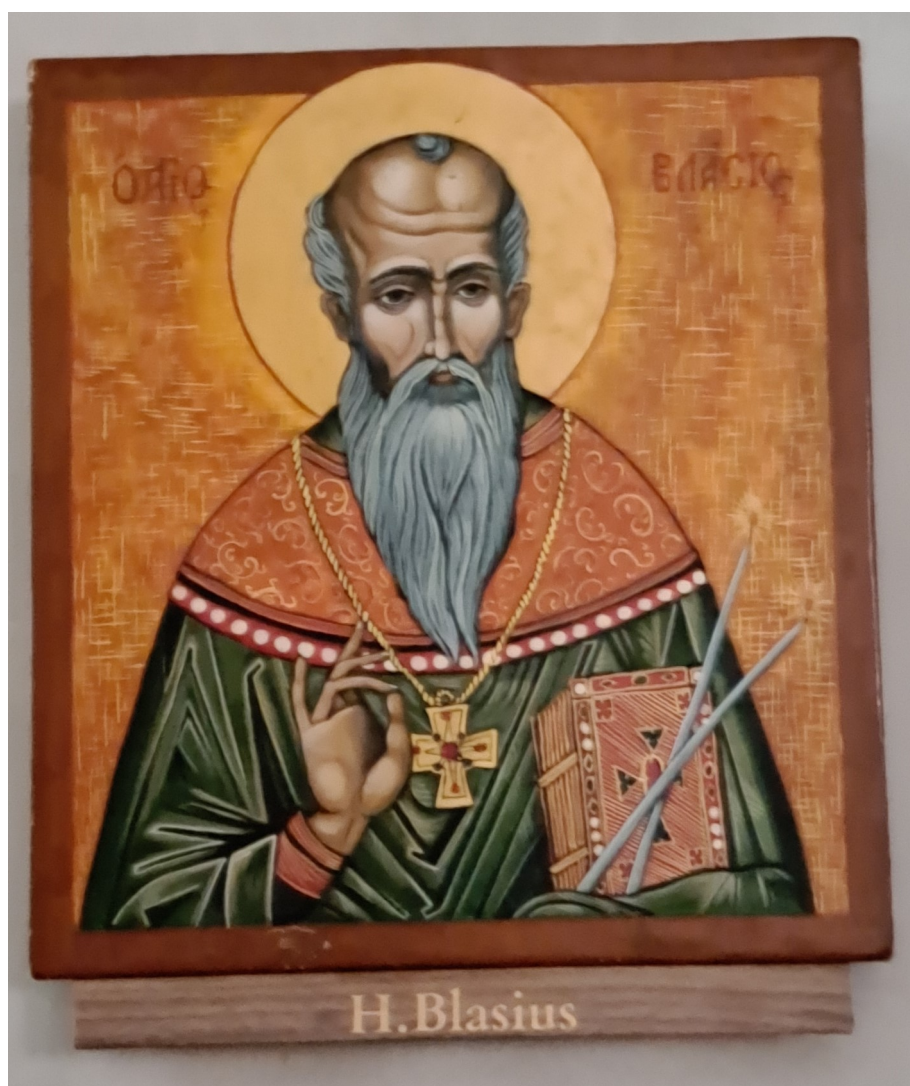
Icoon Heilige Blasius