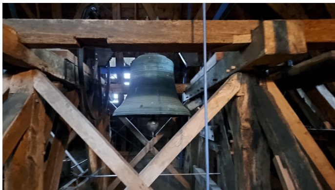
Klok onze vader

De afgelopen zondagen waren er regelmatig gasten in onze diensten, soms zelfs hele banken vol. Een vraag die me werd gesteld is: waarom luidt tijdens het Onze Vader de klok? Dit is vooral een gebruik uit de Lutherse Kerk, met als doel dat mensen in de omgeving dan horen dat op dat moment in de kerk het Onze Vader wordt gebeden. Maar je kunt het ook op een andere manier duiden: de klok waaiert ons gebed uit over Stad- en Ambt Delden met als teken dat we niet alleen bidden voor en met onszelf in de kerk, maar ook voor en met al degenen die niet in de kerk zijn.