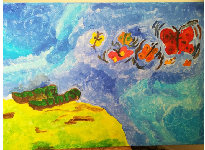
Ds. Klaas van der Kamp– de rups en de vlinder