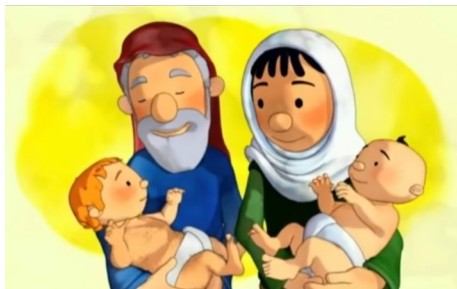
Jakob en Esau en de kinderen

Isaak trouwt met zijn nicht Rebekka. Dit was in deze tijd heel gewoon. Ook zij konden eerst geen kinderen krijgen. Ze werden steeds ouder en daarom vroeg Isaak God om hulp. God luisterde naar Isaak's gebed en Rebekka werd zwanger. Ze kregen een tweeling: Jakob en Esau. Hierover gaat het derde en laatste deel van de stamouders van de Israëlieten.