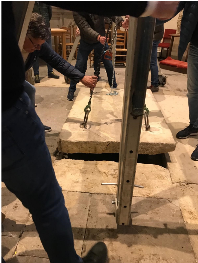
Het lege graf

De Paasdienst had als thema “het lege graf”. In de 6 jaar dat ik nu in Delden ben, heb ik allerlei verhalen gehoord over de grafkelders onder de kerk. De ene variant was dat de kelder helemaal onder water stond, een andere variant dat er nooit geruimd is en de stoffelijke resten hier nog rusten. En er is een variant dat met de restauratie in de jaren '60 de kelders wel zijn geruimd en het graf dus leeg is. In de week na Pasen is bij een gelegenheid de grafkelder geopend en de kelder was niet leeg. Verre van. Van minstens 13 mensen zijn stoffelijke resten aangetroffen en wel in een vorm die past bij het Pinksterverhaal van Ezechiël: de dorre beenderen. En zo merk je weer hoe de Oude Blasius een kerk is gefundeerd op de inzet van mensen uit vele eeuwen. De resten in de grafkelder, die laten we verder rusten.