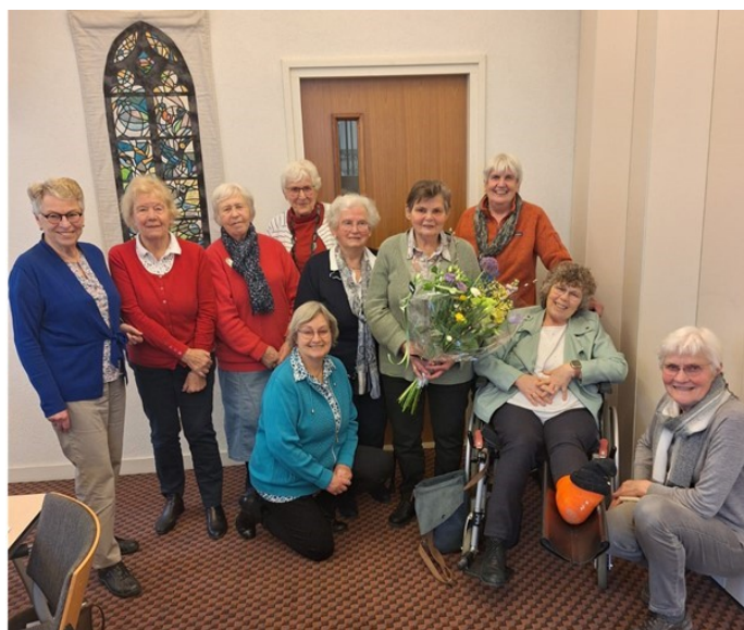
Ouderenbezoek Protestantse gemeente

Al +/- 50 jaar wordt er door een aantal gemeenteleden ouderen van 80 jaar en ouder bezocht. Een aantal van onze bezoekers is zelf 80+. Wij willen dan ook het bezoekwerk overdragen aan de ouderlingen en wijkcontactpersonen.