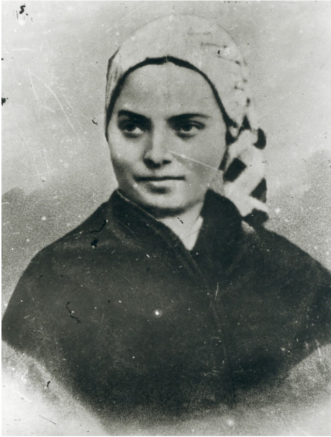
De Heilige Bernadette Soubirous

Liefde in het Saint-Gildardklooster in Nevers. Daar overleed ze in 1879. Sinds 1925 ligt haar lichaam opgebaard in een glazen schrijn in de kloosterkapel.