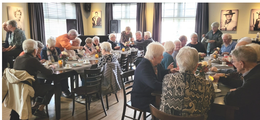
Vorbereidende viering voor Pasen

Op woensdag 20 maart 2024 was in de kerk een Eucharistieviering als voorbereiding op Pasen. Ongeveer 60 parochianen en leden van de KBO hebben hieraan gehoor gegeven. Na deze mooie viering was er een gezellig samenzijn in het Parochiehuus.